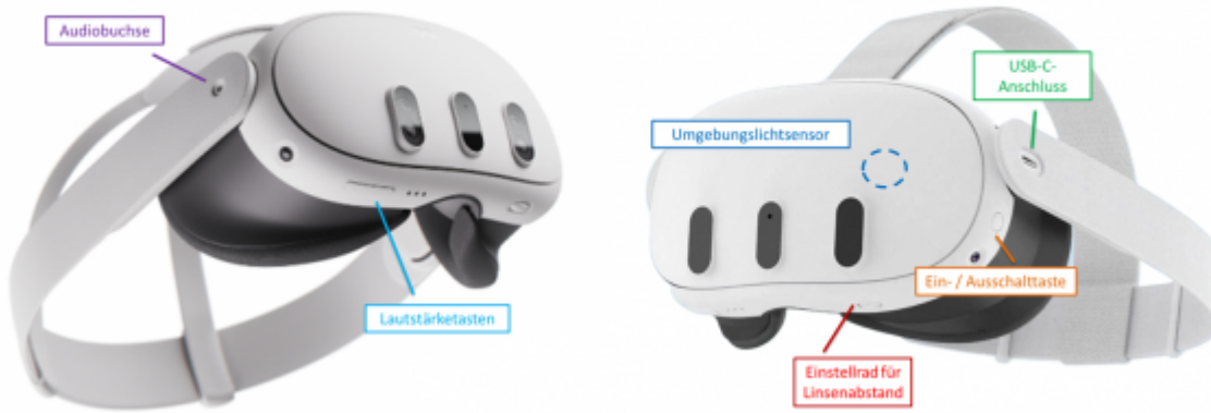
Abbildung 1: Aufbau des Headsets; eigene Darstellung verändert von links externe Verlinkung (10.10.2024) und rechts externe Verlinkung (10.10.2024)