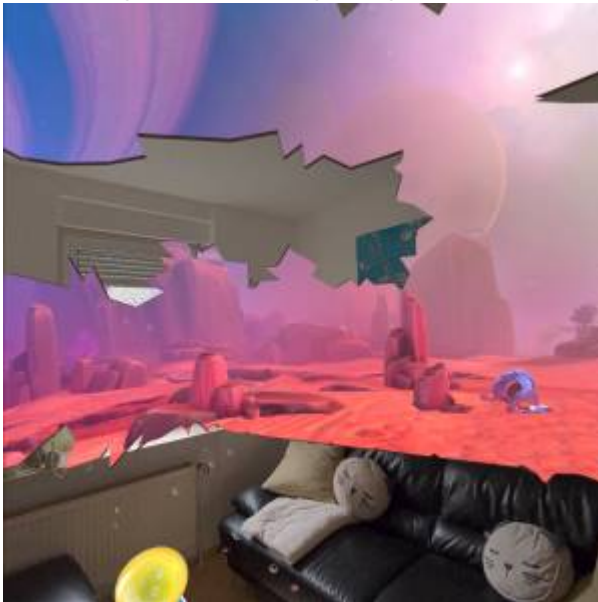
Abbildung 4: Mixed Reality bei First Encounters

Begrenzungen definieren den Bereich, in dem Sie sich gefahrlos während der Nutzung der VR-Brille bewegen können. Diese Begrenzungen werden in der VR-Brille hinterlegt.