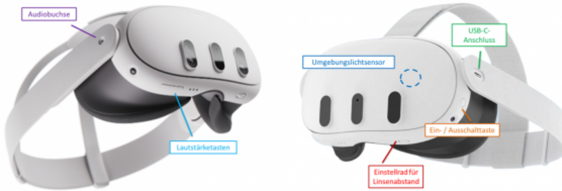
Abbildung 1: Aufbau des Headsets; eigene Darstellung verändert von links externe Verlinkung (10.10.2024) und rechts externe Verlinkung (10.10.2024)