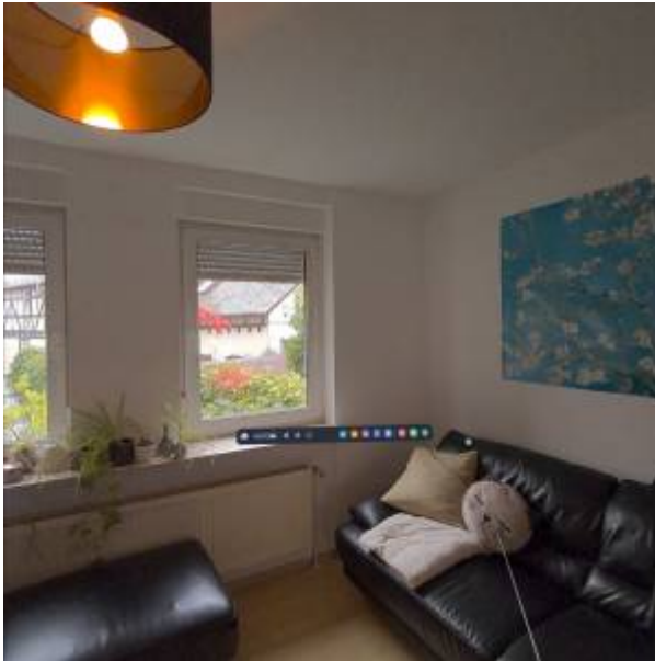
Abbildung 3: Passthrough