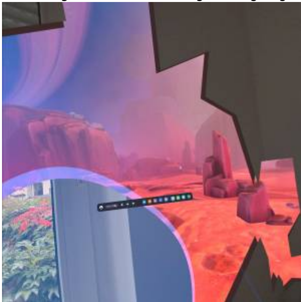
Abbildung 6: Aufnahme beim Überschreiten der Begrenzung

Begrenzungen können bei den Einstellungen unter Physischen Raum festgelegt oder bearbeitet werden.