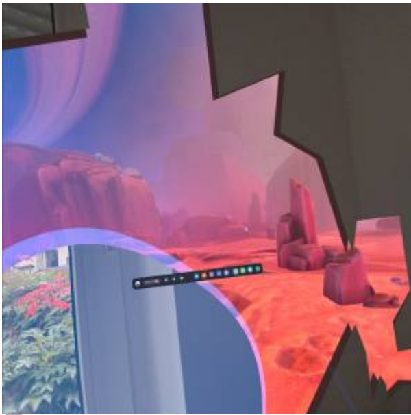
Abbildung 6: Aufnahme beim Überschreiten der Begrenzung

Begrenzungen können bei den Einstellungen unter Physischen Raum festgelegt oder bearbeitet werden.