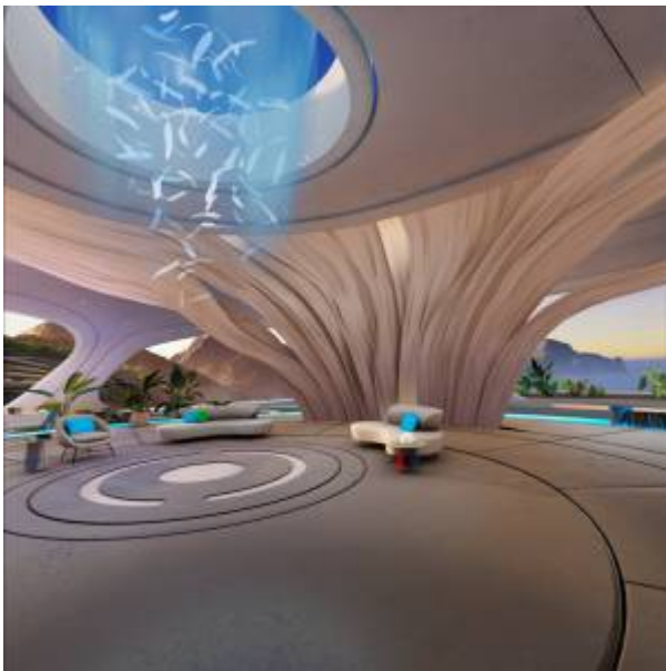
Abbildung 2: Immersiver Modus

Passthrough bedeutet, dass das Bild der Kameras der Brille auf deren Display angezeigt wird. Die Übertragung des physischen Raums geschieht etwas verzögert und besonders die Tiefendarstellung kann verzogen sein. Die Mixed Reality Umgebung ergänzt das projizierte Bild der physischen Welt mit virtuellen Inhalten und kombiniert somit beide Welten.