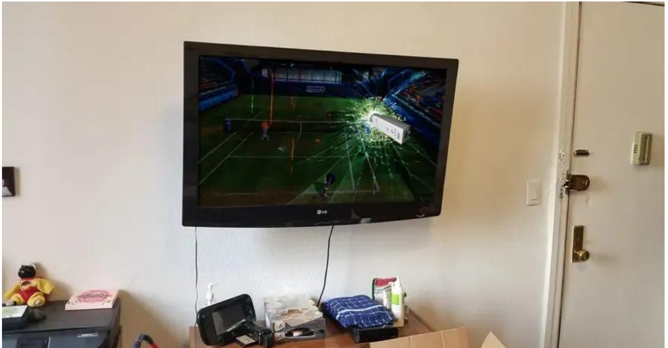
Abbildung 1: Abbildung von externer Link

Wir bitten Sie, bei der Nutzung der Controller die Handschleifen anzulegen . Dies dient nicht nur zur Sicherheit der Controller selbst, sondern auch zur Sicherheit Ihrer Umgebung.