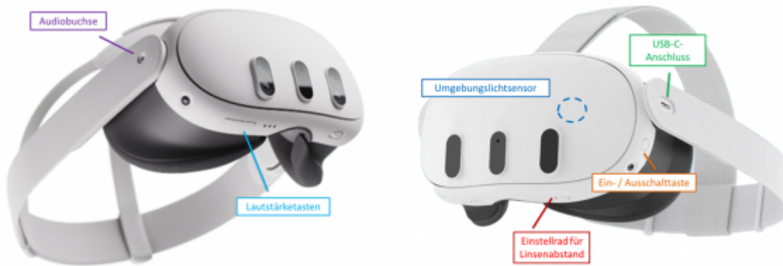
Abbildung 1: Aufbau des Headsets; eigene Darstellung verändert von links externe Verlinkung (10.10.2024) und rechts externe Verlinkung (10.10.2024)