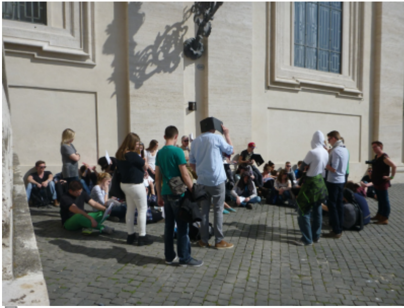
Abbildung 1: Ansprache vor dem Petersdom in Rom bei 24 Grad in der Sonne

Szenario: Am Rande des Petersplatzes vor dem Petersdom in Rom hat sich eine Gruppe junger Menschen in praller Sonne versammelt. Eine Person spricht zu der Gruppe, viele halten Papiermaterial in ihren Händen. Es handelt sich offensichtlich um eine Exkursion bzw. Studienfahrt, die genau diesen Standort auf dem Petersplatz als geeignet angesehen hat, um eine wohlfeile Ansprache im Gelände bzw. ein Referat zu halten. Die Gruppe hat sich im Halbkreis angeordnet und ist mit über 30 Personen unübersichtlich groß. Ein Großteil der Teilnehmenden sitzt auf dem Boden und verdeckt einander. Im Hintergrund unterhalten sich ein paar Teilnehmende. Wenig als ein Drittel setzt sich mit dem zur Verfügung stehenden Material auseinander. Einigen scheint es sinnvoller zu sein, es als Sonnenschutz zu nutzen. Insgesamt scheint die Gruppe wenig motiviert zu sein, der Ansprache zu folgen.