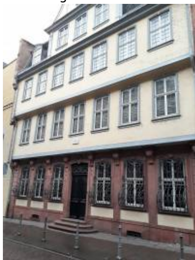
Abbildung 4: Adresse Großes Hirschgraben 23-25, 60311 Frankfurt am Main