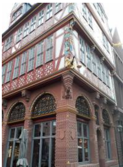
Abbildung 2: Verbale Beschreibung „Wir treffen uns vor der goldenen Waage“