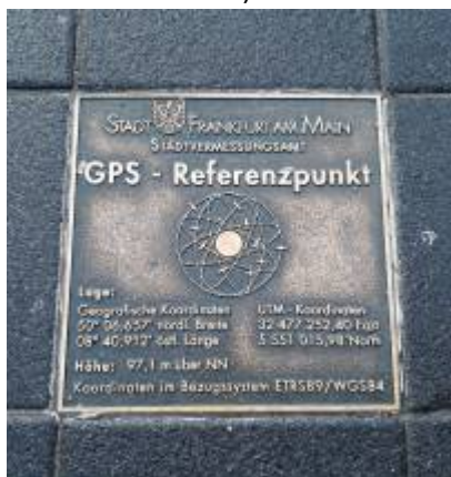
Abbildung 3: Koordinaten 50° 06,657' N 08° 40,912' E