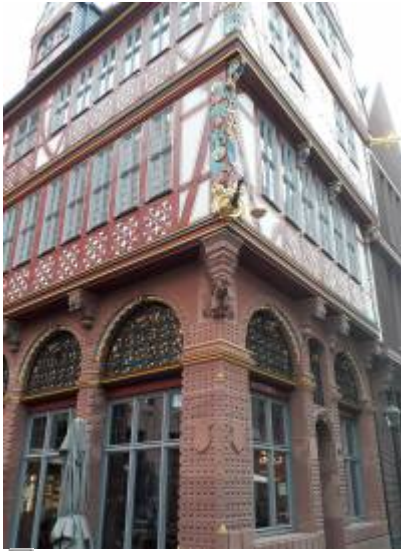
Abbildung 1: „Wir treffen uns vor der goldenen Waage“ eigene Aufnahme 2023

From: https://foc.neu.geomedienlabor.de/ - Frankfurt Open Courseware